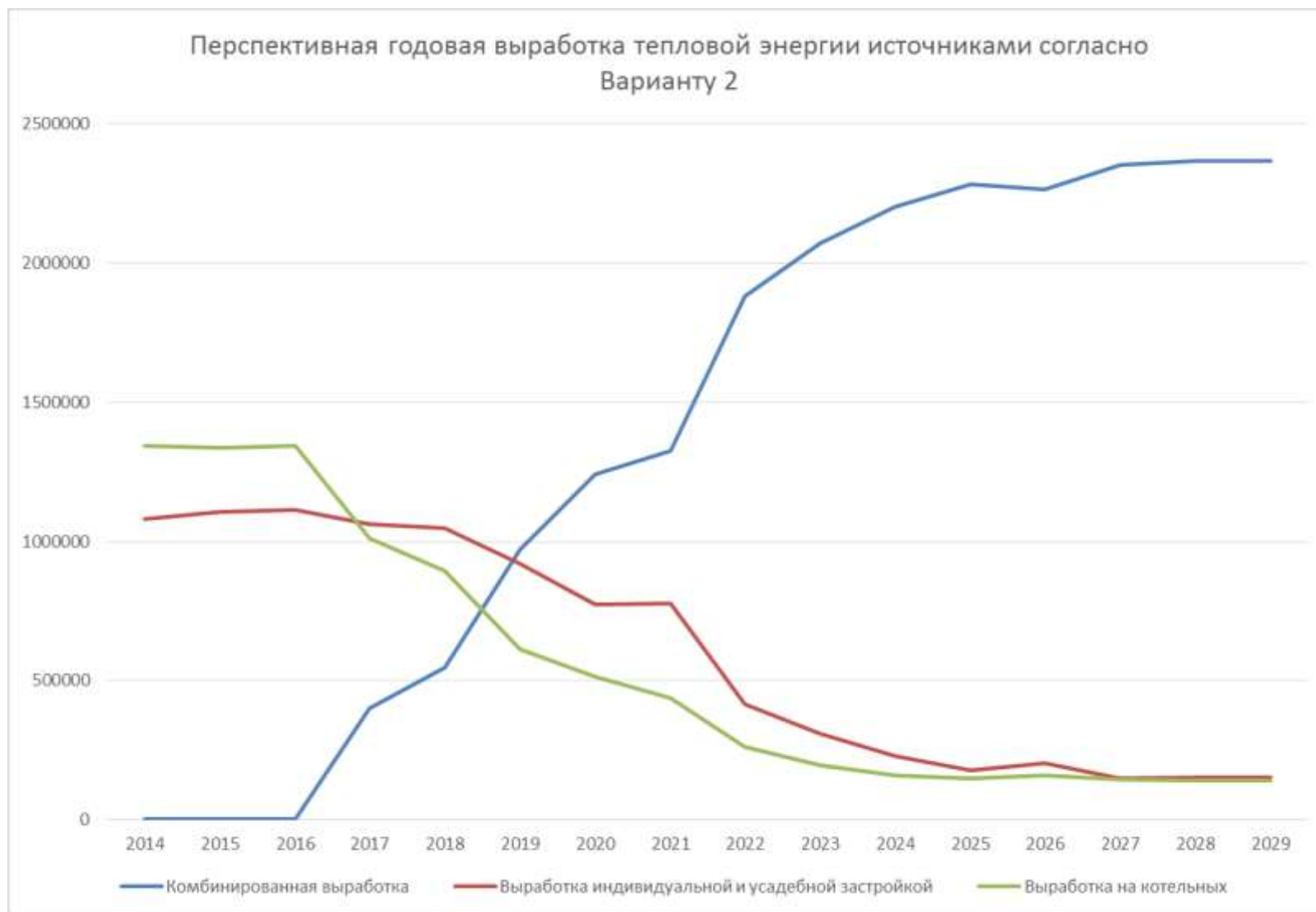
Рисунок 3.1 – Перспективная годовая выработка тепловой энергии источниками согласно Варианту 2