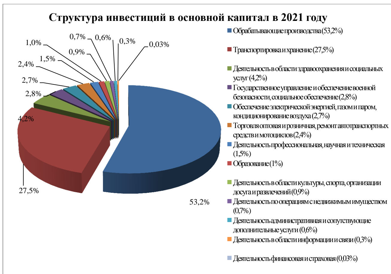
Рис. 1. Отраслевая структура инвестиций в основной капитал в 2021 году

Ниже приведена структура инвестиций в основной капитал по крупным и средним предприятиям и организациям города Таганрога в разрезе видов экономической деятельности в 2021 году (рис. 1).