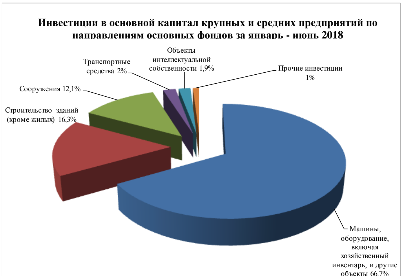
Рис.2. Распределение инвестиций в основной капитал крупных и средних предприятий по направлениям основных фондов за январь-июнь 2018 года

Анализ распределения инвестиций в основной капитал по направлениям в соответствии с классификацией основных фондов (Рис. 2) свидетельствует о том, что основная их часть направлена на машины, оборудование, включая хозяйственный инвентарь, и другие объекты – 66,8 %, а также воспроизводство зданий (кроме жилых) – 16,3 %, сооружений – 12, % и прочие.