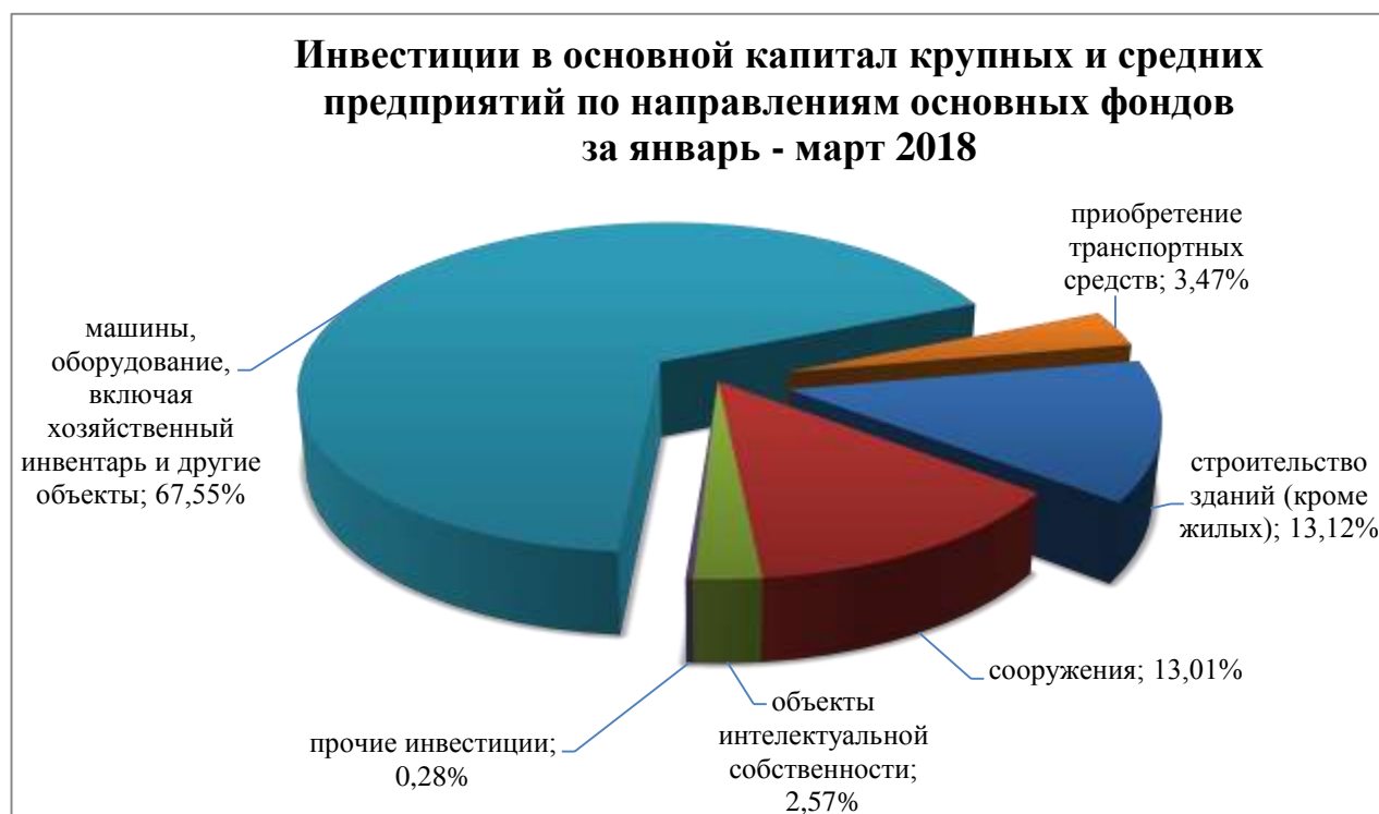
Рис.2. Распределение инвестиций в основной капитал крупных и средних предприятий по направлениям основных фондов за январь-март 2018 года

Анализ распределения инвестиций в основной капитал по направлениям в соответствии с классификацией основных фондов (Рис. 2) свидетельствует о том, что основная их часть направлена на приобретение машин, оборудования, включая хозяйственный инвентарь и другие объекты – 67,55%, на строительство зданий (кроме жилых) – 13,12%, и сооружений – 13,01%.