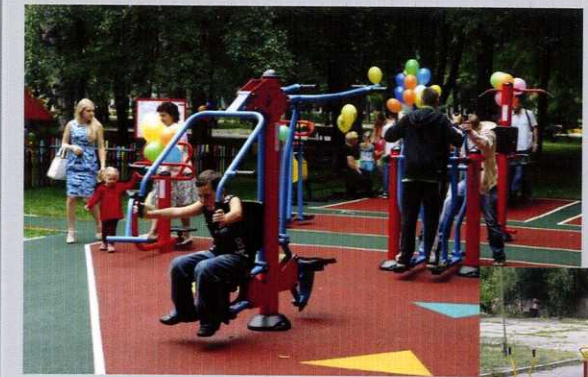
установка уличных тренажеров 10 шт