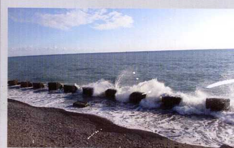
Установка волноломов (60 шт.)