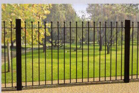
Устройство металлического ограждения территории h=2.2 м.