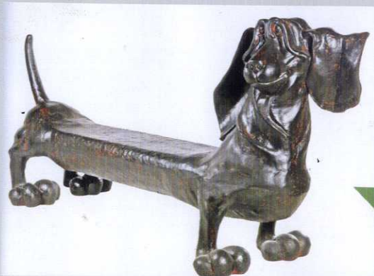
МАФ скамья "Такса" 2 шт