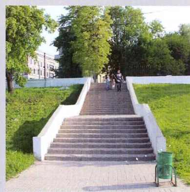
Ремонт бетонных лестниц