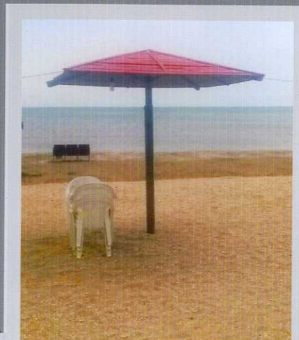
солнцезащитные грибки 5 шт