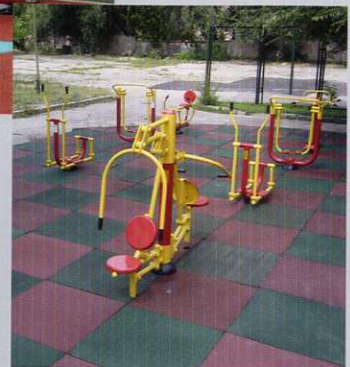
Площадка с уличными тренажерами