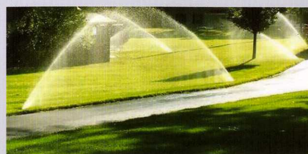
Устройство системы орошения (1я очередь)