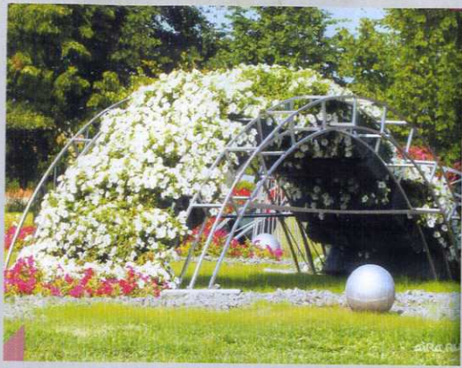
МАФ кашпо "Горка"

Покрытие травмобезопасной резиновой плиткой (футбольная, авиамодельная, тренажерная и детская площадки)