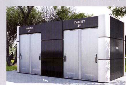
Установка двух туалетов с подключением к сетям В и