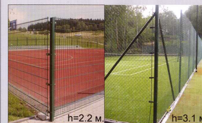
Устройство металлического ограждения игровых и спортивных площадок