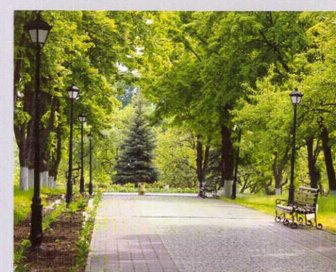
Устройство покрытия аллей из тротуарной плитки и поребрика