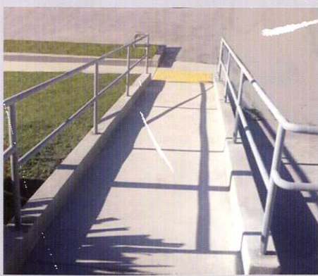
Устройство бетонного пандуса с ограждением для МГН