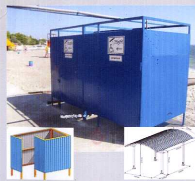
Установка раздевалки и солярия Асфальтирование малой набережной.