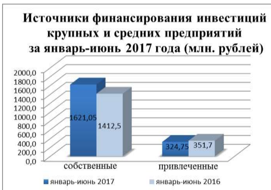
Рис.1. Структура источников финансирования инвестиций крупных и средних предприятий за январь-июнь 2017 года (млн. рублей).

принадлежит собственным средствам предприятий и организаций - 83,3%. (80,1% за январь-июнь 2016 года) (Рис. 1).