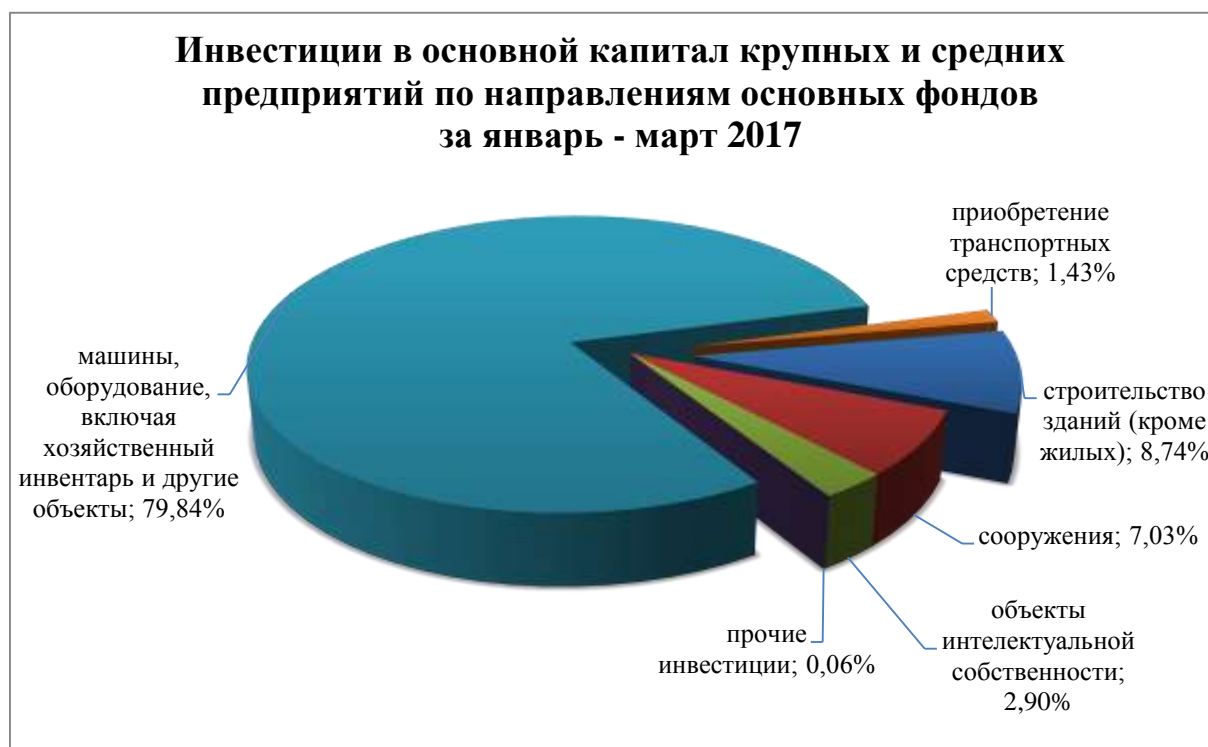
Рис.2. Распределение инвестиций в основной капитал крупных и средних предприятий по направлениям основных фондов за январь-март 2017 года

Анализ распределения инвестиций в основной капитал по направлениям в соответствии с классификацией основных фондов (Рис. 2) свидетельствует о том, что основная их часть направлена на приобретение машин, оборудования, включая хозяйственный инвентарь и другие объекты - 79,84 %, на строительство зданий (кроме жилых) - 8,74 %, и сооружений - 7,03 %.