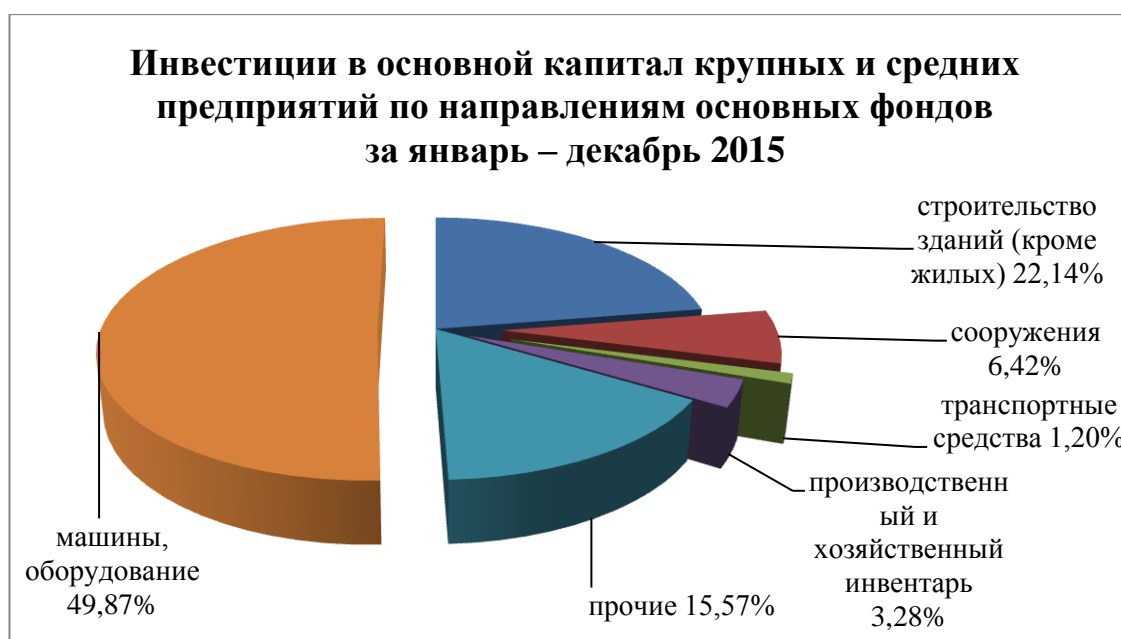
Рис.2. Распределение инвестиций в основной капитал крупных и средних предприятий по направлениям основных фондов за январь-декабрь 2015 года

Анализ распределения инвестиций в основной капитал по направлениям в соответствии с классификацией основных фондов (Рис. 2) свидетельствует о том, что основная их часть направлена на приобретение активной части основных фондов - машин и оборудования – 49,9 % , прочих видов – 15,6 % , а также на воспроизводство зданий (кроме жилых) – 22,1 % . Заметно сократилась доля инвестиций, направленных крупными и средними предприятиями на строительство жилья – 1,5 % , (около 3,9 % в январе-декабре 2014 года).