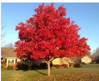
- Красный Клен