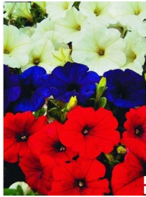
- Петунья (белая, красная, синяя);