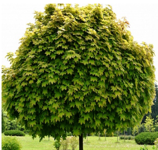
- Клен остролистный «Глобозум»;