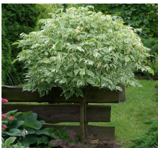
- Дерен Белый;