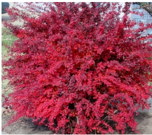
- Барбарис Красный.