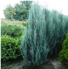
- Можжевельник Скальный;