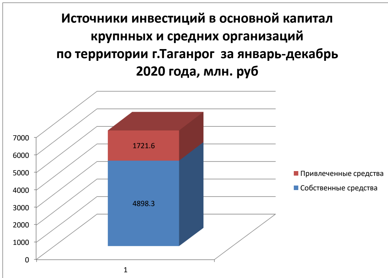
Рис. 2. Источники инвестиций в основной капитал крупных и средних организаций по территории г.Таганрог за январь-декабрь 2020

Можно сделать вывод, что относительно января – декабря 2019, в текущем периоде наблюдается сокращение доли собственных средств предприятий направленных на инвестиции и повысился уровень привлеченных средств. Из привлеченных средств основная доля приходится на бюджетные инвестиции – 1 357 809 тыс. руб (20,5% от всех источников).