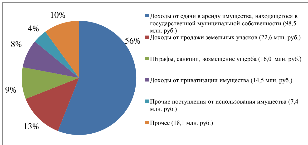
Структура неналоговых доходов бюджета

Неналоговые доходы поступили в сумме 177,1 млн. рублей, что выше планируемого на 33,3 млн. рублей.