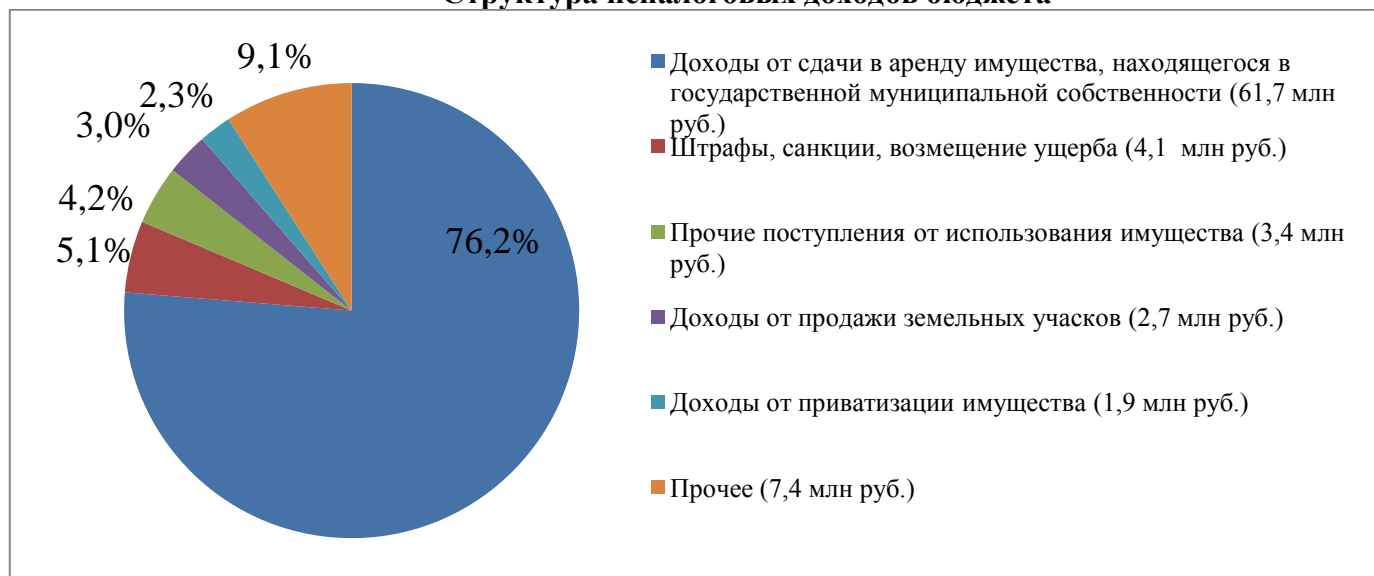
Структура неналоговых доходов бюджета

Неналоговые доходы поступили в сумме 81 млн. рублей: