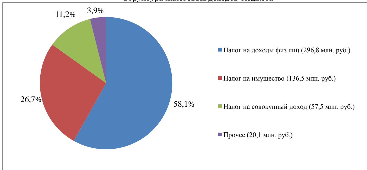
Структура налоговых доходов бюджета

Неналоговые доходы поступили в сумме 81 млн. рублей: