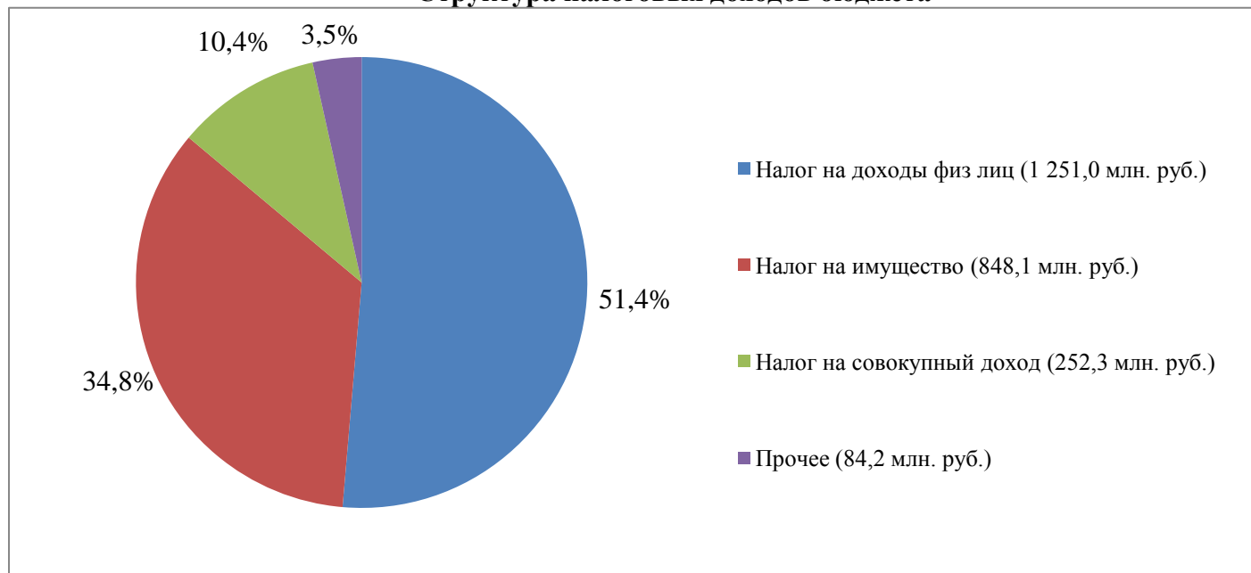
Структура налоговых доходов бюджета

Неналоговые доходы поступили в сумме 354,0 млн. рублей, что выше планируемого на 5,9 млн. рублей.