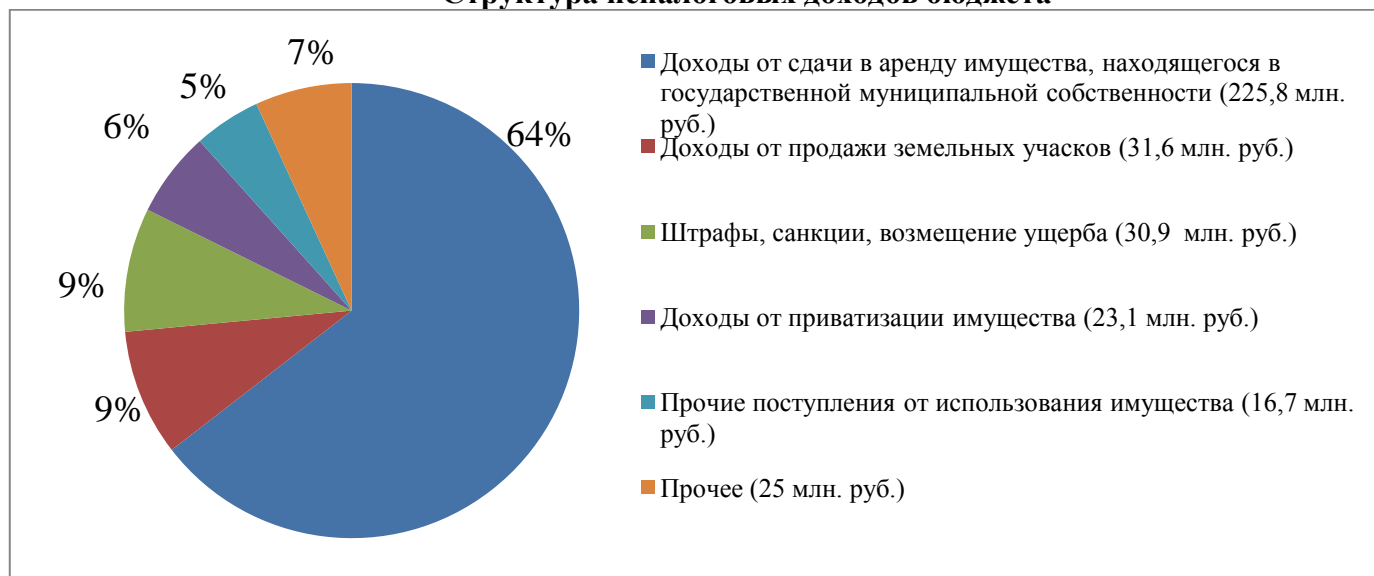
Структура неналоговых доходов бюджета

Неналоговые доходы поступили в сумме 354,0 млн. рублей, что выше планируемого на 5,9 млн. рублей.