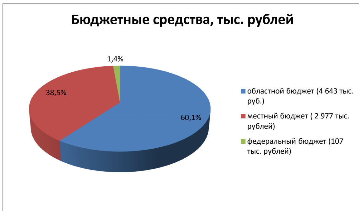
Рис. 4 Структура бюджетных средств в основной капитал по кругу крупных и средних предприятий, осуществляющих деятельность на территории города Таганрога, по итогам января-марта 2023 года

В структуре бюджетных средств наибольшую долю занимает областной бюджет – 60,1%; местный бюджет – 38,5%; федеральный бюджет – 1,4% (рисунок 4).