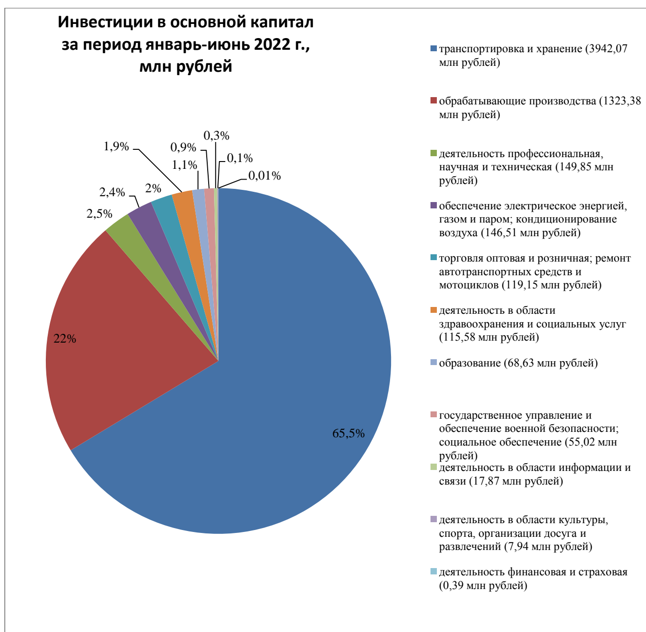
Рисунок 1. Структура инвестиций в основной капитал по крупным и средним предприятиям за период январь-июнь 2022 года

Структура инвестиций в основной капитал по крупным и средним предприятиям за период январь-июнь 2022 года отражена на рисунке 1.