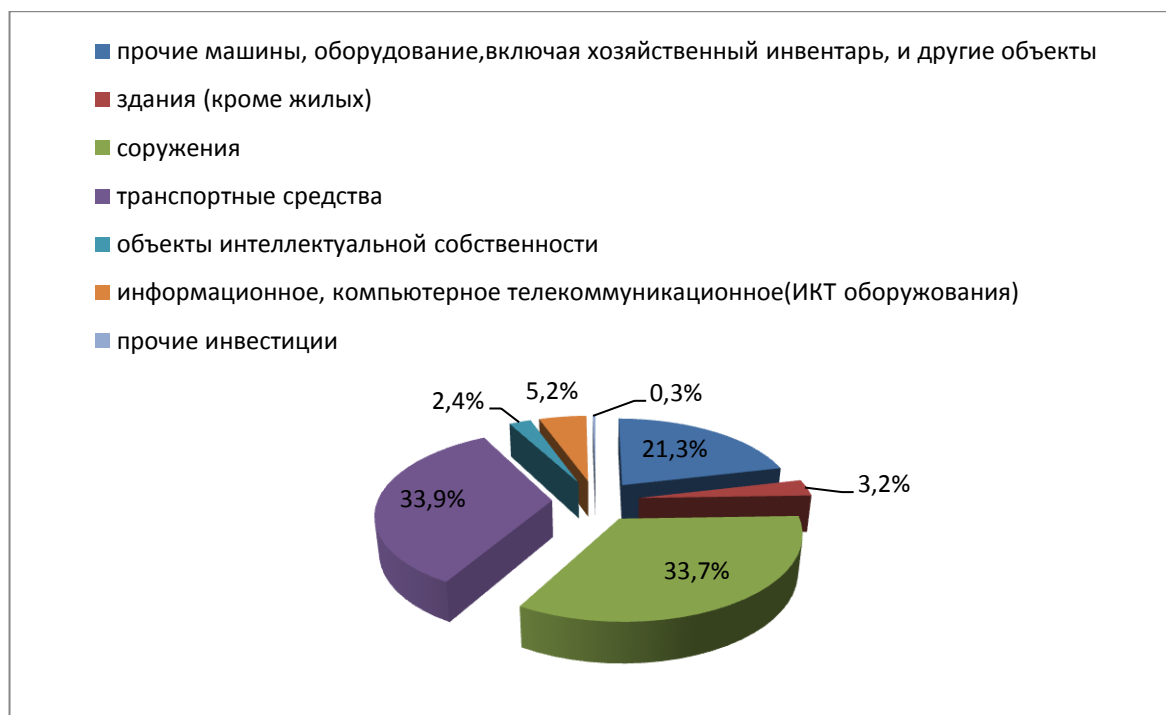
Рисунок 2. Анализ видовой структуры инвестиций в основной капитал по кругу крупных и средних предприятий, осуществляющих деятельность на территории города Таганрога, по итогам января-июня 2022 года