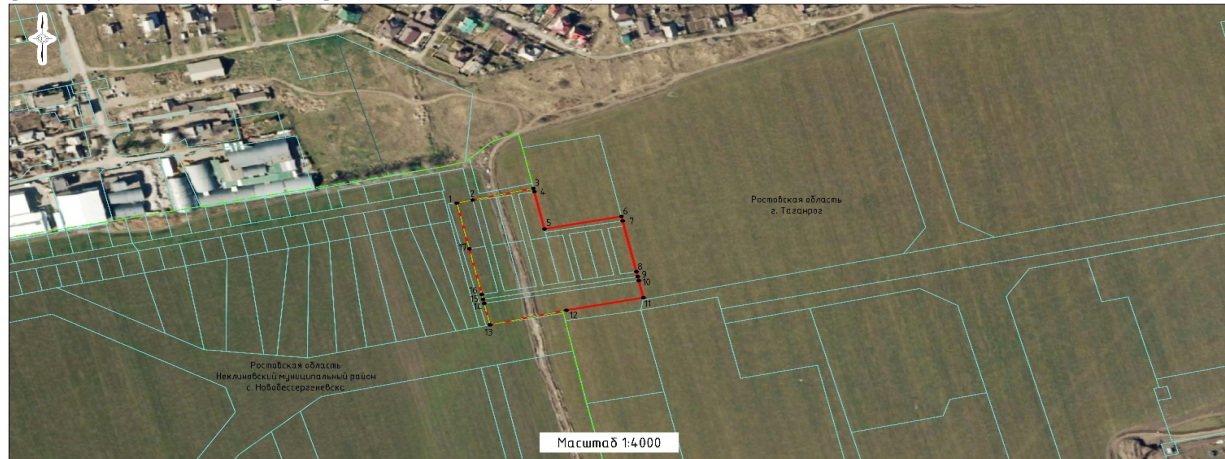
Схема границ территории проектирования проекта планировки и проекта межевания территории для размещения жилой застройки на земельных участках, расположенных около ул. Паустовского, 48-а в городе Таганроге, Ростовской области